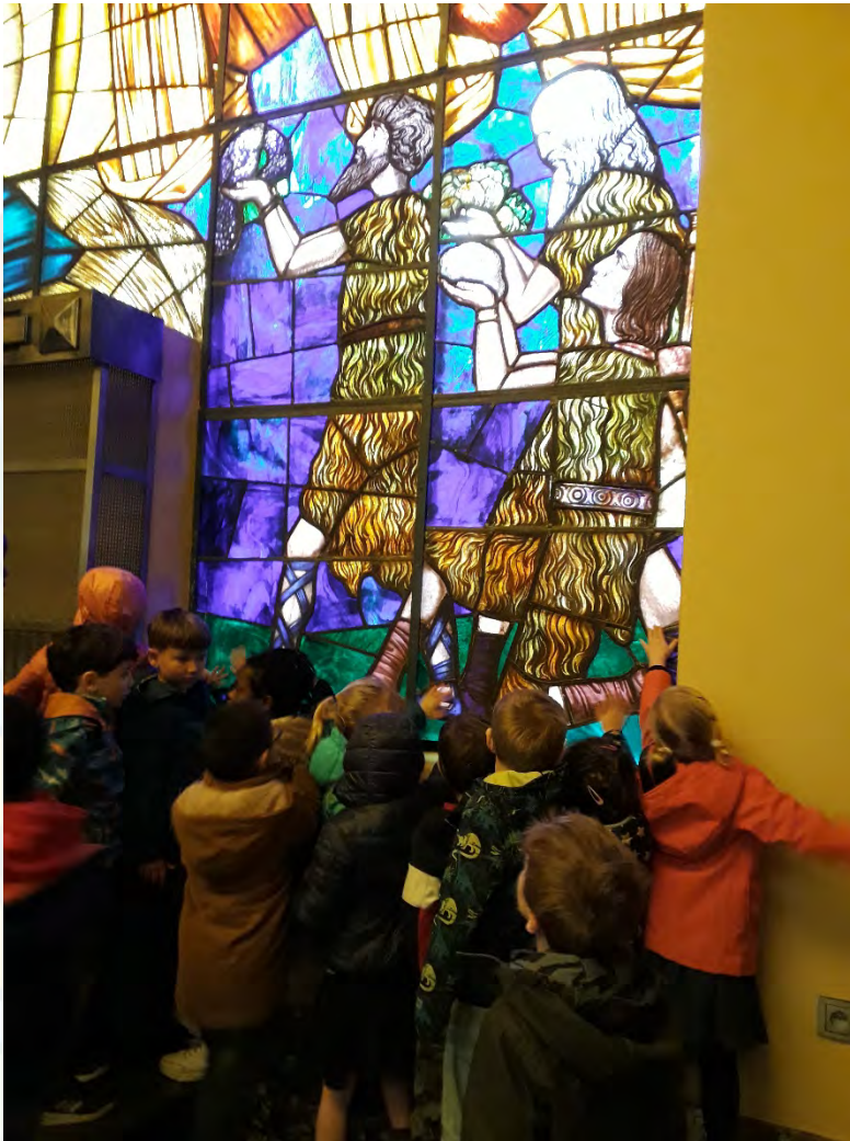
De 3de kleuterklas van het HHH op bezoek in de Boodschapkapel.