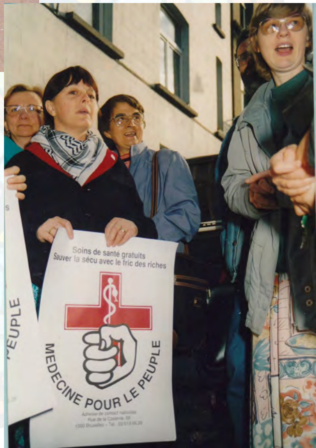
Dokters van het Volk

Daar groeide haar syndicaal engagement. Ze werd afgevaardigde in het bedrijf en maakte deel uit van het gewestelijk ACV-bestuur en van het bestuur van de textielcentrale waaronder het bedrijf viel. Haar kennismaking met de organisatie Calama bracht haar omstreeks 1976-1977 voor het eerst op het strijdbare spoor. De leden van de groep kwamen drie maal per week samen. Ze bestudeerden de teksten van het Tweede Vaticaans Concilie, maar ook boeken van bevrijdingstheologie en het marxisme. Ze vonden ook steun en inspiratie in de beweging ‘Christenen voor het socialisme’.