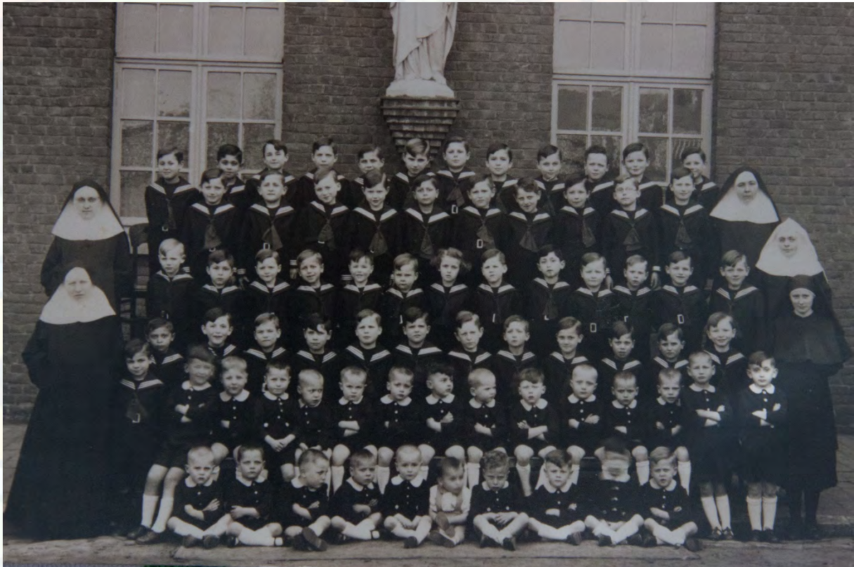
Weeshuis van de zusters van het Huis van Barmhartigheid in Heverlee

Het boek is, dankzij zijn grote succes, ondertussen aan een tweede druk toe. Meer informatie over het boek vind je hier .