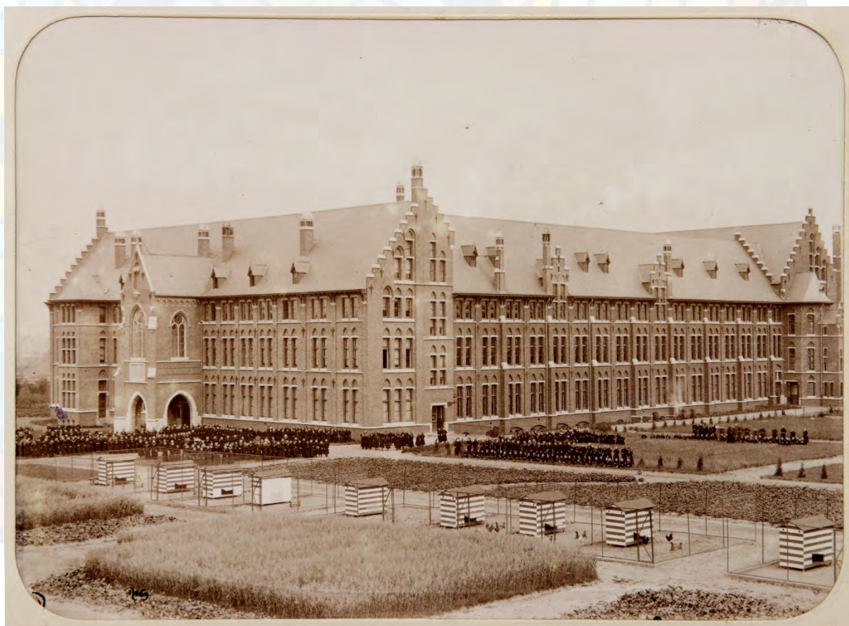
Het Heilig Hartinstituut in 1897