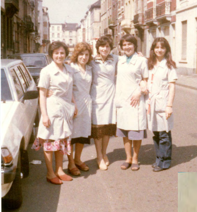
1975: middagpauze van de wasserij Euroblan

“Steeds meer drong de vraag zich op: zijn de mensen geholpen met een arme of een verdrukte meer?” Zuster-arbeidster Jozefine begon zich af te vragen wat de vakbond in de fabriek deed.