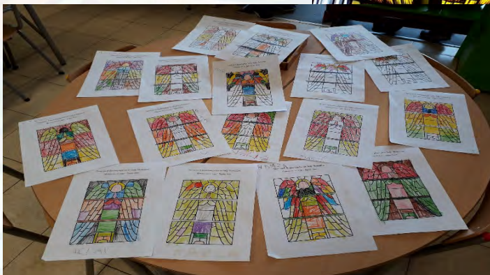
Verslag: juf Rozemie Couckuyt