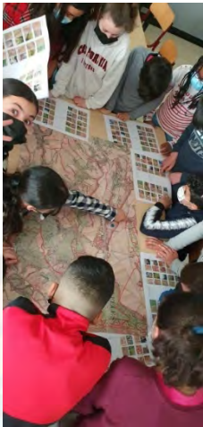
Regina Assumpta

In eerdere nieuwsbrieven maakte je al kennis met het project Slimerfgoed.be, een samenwerking tussen Cultureel Erfgoed Annuntiaten Heverlee, KADOC en vele andere partners met wie we samen maar liefst vier proeftuinen organiseren met de bedoeling een hopelijk blijvende brug te slaan tussen de erfgoedsector en het onderwijs.