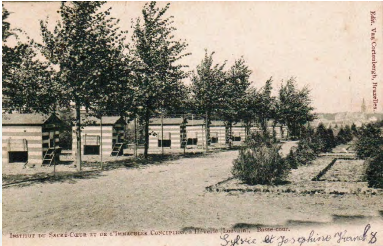
De kippenhokken van het Heilig Hartinstituut