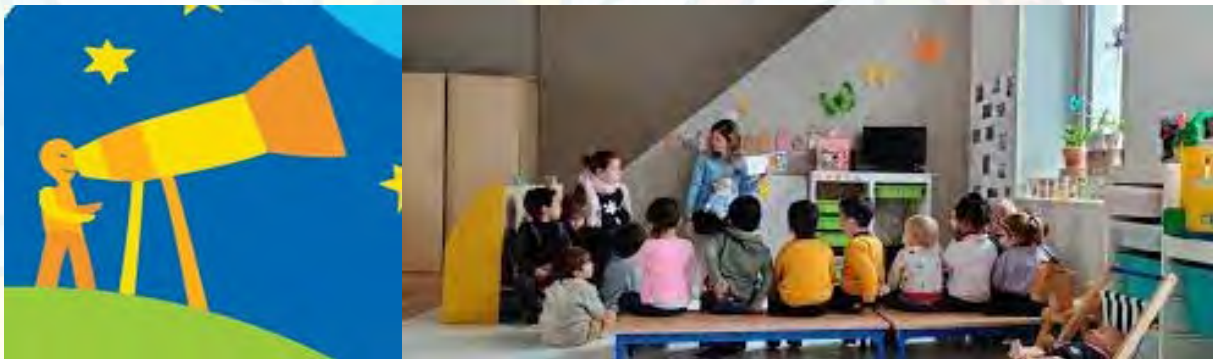
De Telescoop, Laken

Deze vormingsreeks richt zich tot schooldirecties en leerkrachten uit het basis- en secundair onderwijs, en biedt antwoorden op vragen als: