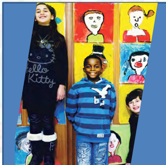
Regina Assumpta, Anderlecht

Scholen hebben een lange geschiedenis of zijn daarentegen nog niet zo lang geleden begonnen met een nieuw verhaal. In beide gevallen en zowel in het basis- als secundair onderwijs is werken met schoolerfgoed rond de identiteit van de school boeiend en verbindend. In enkele Brusselse scholen gingen leerkrachten deze uitdaging aan. Het scholenlandschap is volop in beweging en de scholenbevolking is superdivers. Hier wordt m.a.w. de samenleving van morgen gemaakt. Welke ontwerpprincipes hanteerden zij voor het ontwikkelen van deze activiteiten? Hoe knoopten ze aan bij de leerdoelen? In deze sessie getuigen zij hoe ze aan de slag gingen en wisselden ze hun ervaringen uit.