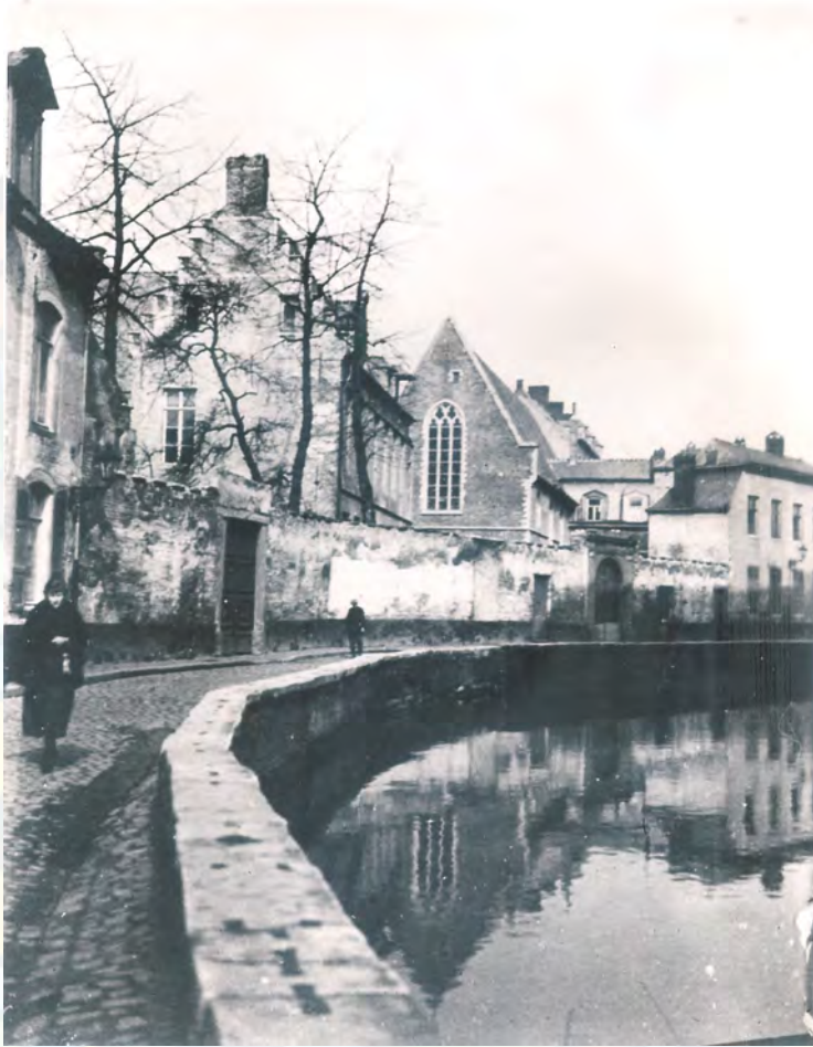
De schol in de Halvestraat

Na de feestzitting "bezocht men de ruime zalen, waar de praktische, deugdelijke en goedkope werken der leerlingen tentoongesteld waren, de slaapzalen, de kapel de stal en de melkerij.